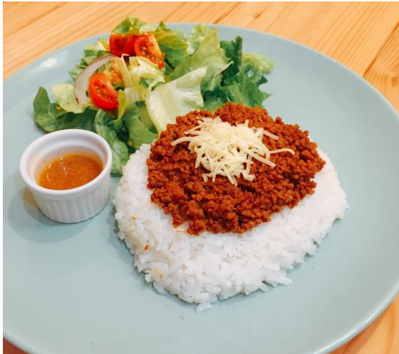
キッズタコライス