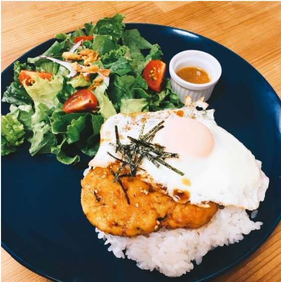
甘辛鶏つくねのロコモコ