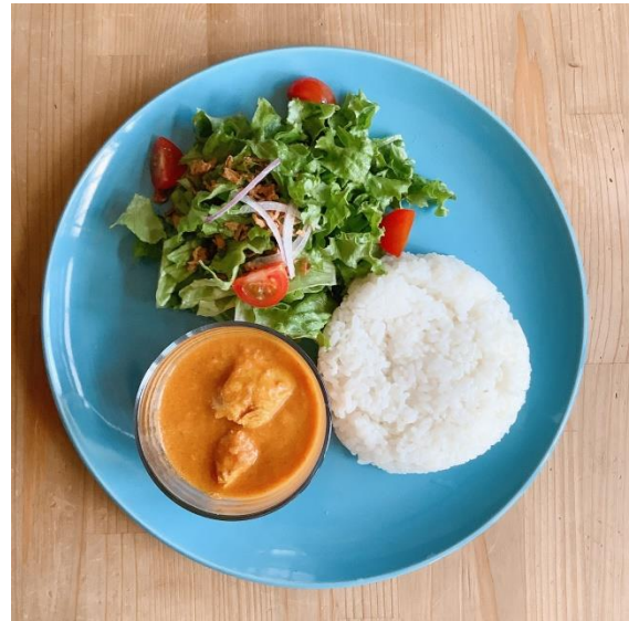
バターチキンカレー