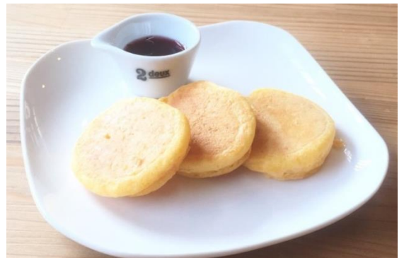
1オさんパンケーキ (297円税込み)